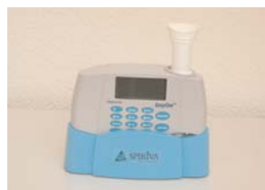
Das Easyone in der speziellen COPD-Screening Ausführung

Ergo: Die Spirometrie in der Praxis muss verbessert werden