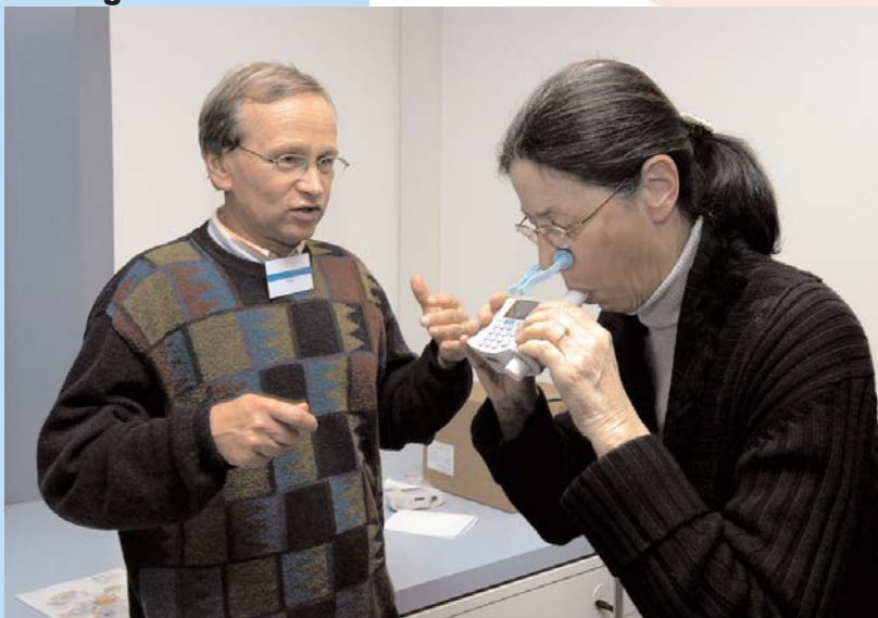
Reproduzierbare Messungen dank engagiertem Coaching bei der Testdurchführung

bisher angenommen. Ohne Behandlung und Raucherentwöhnung verschlimmert sich die Krankheit stetig, kann zu stark eingeschränkter Lebensqualität, Behinderung und sogar zum Tod führen. Nach Meinung der Experten besteht dringender Handlungsbedarf.